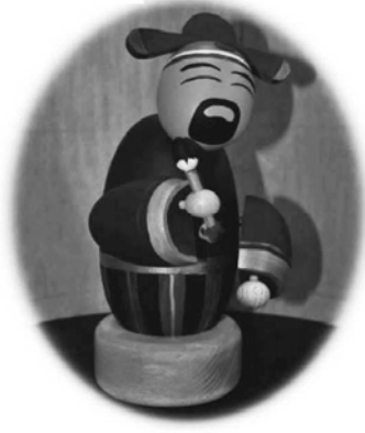
▲文昌 360 度隨祝福音樂轉動。