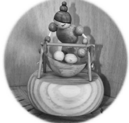
▲懷念童年 360 度隨搖籃曲音樂轉動。