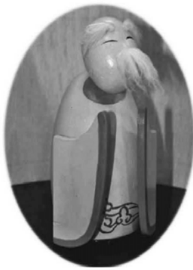
▲音樂機構在月老袍底，360 度隨真愛音樂轉動。