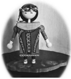
▲音樂機構在身體背部，360 度轉動，帶動雙手趣味擺動，基座台灣造型，特色穩固。