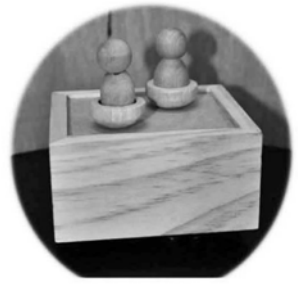
▲兩兩 360 度轉動同時自轉圓舞曲。