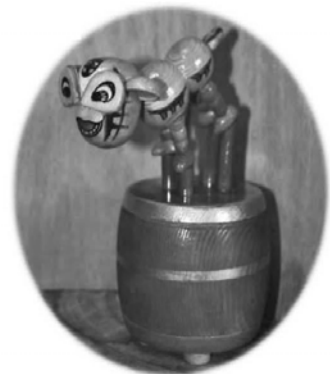
▲舞獅 360 度隨陶笛之歌音樂轉動。