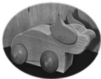
▲生肖牛造形圓潤，樂曲小小世界。